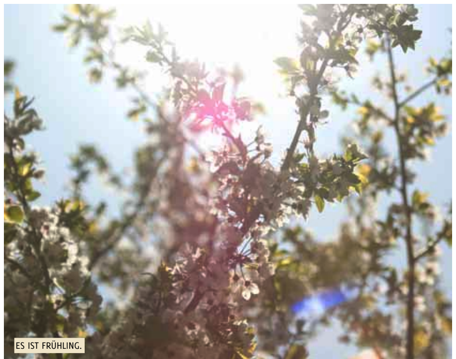
ES IST FRÜHLING.